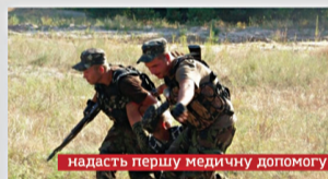
надасть першу медичну допомогу