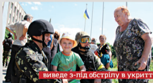
евакуують з небезпечного місця