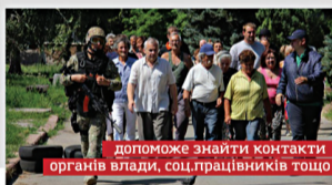
допоможе знайти контакти органів влади, соц.працівників тощо