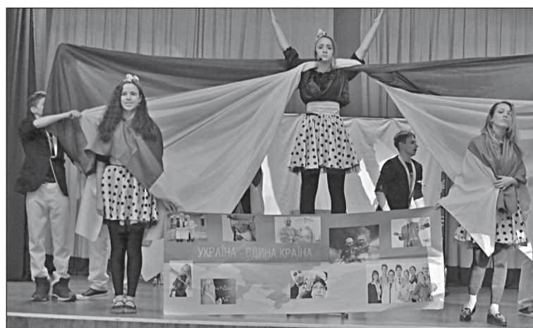
Гордість школи – команда КВН «Вітаміні»