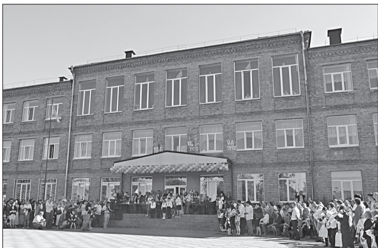
Урочиста лінійка. День знань. 2016 р.

Перед колективом колегіуму-школи амбітні плани. Велике значення тут надають національно-патріотичному та профорієнтаційному вихованню. Передбачено проведення на базі закладу методичних, науково-практичних семінарів, навчань, тренінгів тощо. Тож попереду – велика робота і нові вершини та досягнення.