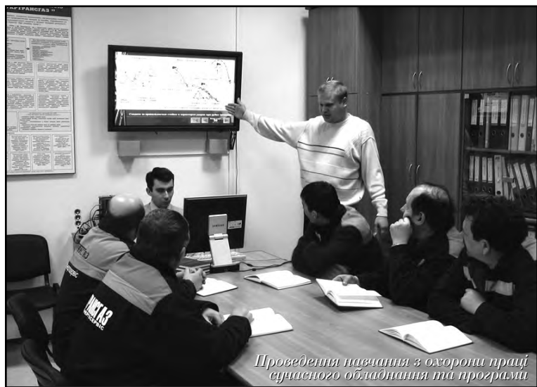
Проведення навчання з охорони праці сучасного обладнання та програм

служби та сумлінне ставлення всіх працівників до виконання покладених на них обов'язків, дає позитивні результати. Так, по нашому управлінню вже понад 10 років не було зафіксовано жодного випадку виробничого травматизму та професійного захворювання, а це - 10 ремонтних бригад, електротехнічна лабораторія, Боярська ремонтна база, дільниця реконструкції компресорних станцій, дільниця автоматики та електрообладнання та автотранспортна дільниця з більш як 170-ма працівниками у різних областях країни. При цьому звернемо увагу на те, що переважна більшість робітників працює в умовах із шкідливими виробничими факторами та підвищеною небезпекою.