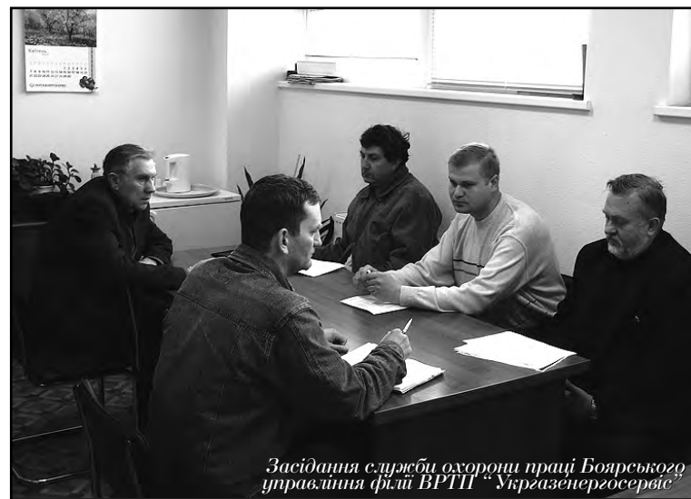
Засідання служби охорони праці Боярського управління філії ВРТП "Укргазсервіс"

Указом Президента України від 18 серпня 2006 року № 658/2006 у нашій державі офіційно впроваджено День охорони праці, який відзначається щорічно 28 квітня у Всесвітній день охорони праці.