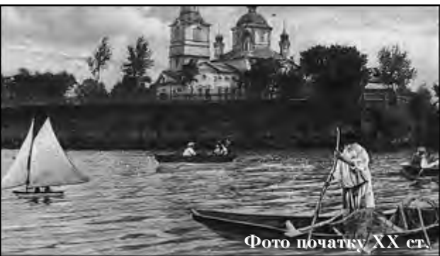
Фото початку XX ст.

лення - Перетвір'я (Перетворье) споріднена з назвою місцевої річки Притвір'я (у документах XVIII ст. - Перетворка, Притворка - від останнього згодом пішла зросійщена форма Притварка). Найімовірніше, в основі назви як городища, так і річки, лежить давньоруське слово "воръ", яке, на думку мовознавців, означало "межа", "загорожа", "частокіл", "обгороджене місце". Нині уже складно з'ясувати, що саме стало першою причиною такої назви: укріплена багаткілометровим Змієвим валом р. Перетворка, яка протікала "предъ воромъ", тобто перед укріпленням-валом, чи зміцнене частоколом поселення Перетворье над нею. Власне, їх неможливо розділити: і річка з валом, і городище жили одним життям, були важливим рубежем на південно-західних околицях Києва, щитом, який надійно прикривав столицю.