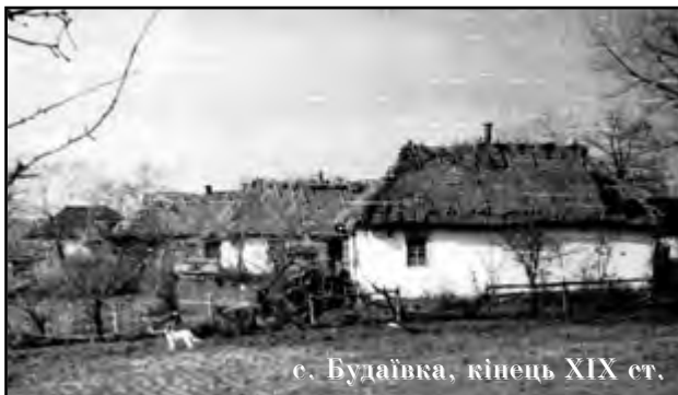
с. Будаївка, кінець XIX ст.

лого", в якій був перелік "добр Васильківських" Києво-Печерської лаври, зокрема "і з палацом на городищі і - Перетвір'ям над річкою Перетворкою - з сільцем та з церквою, і [всім], що там є". Щоправда, це важливе свідчення ускладнюється припущенням дослідників у тому, що "Ставропігійна грамота" в тому вигляді, в якому вона збереглася до нашого часу, є неточним