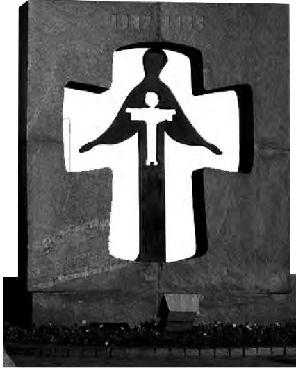
Продовження. Початок на 1 стор.