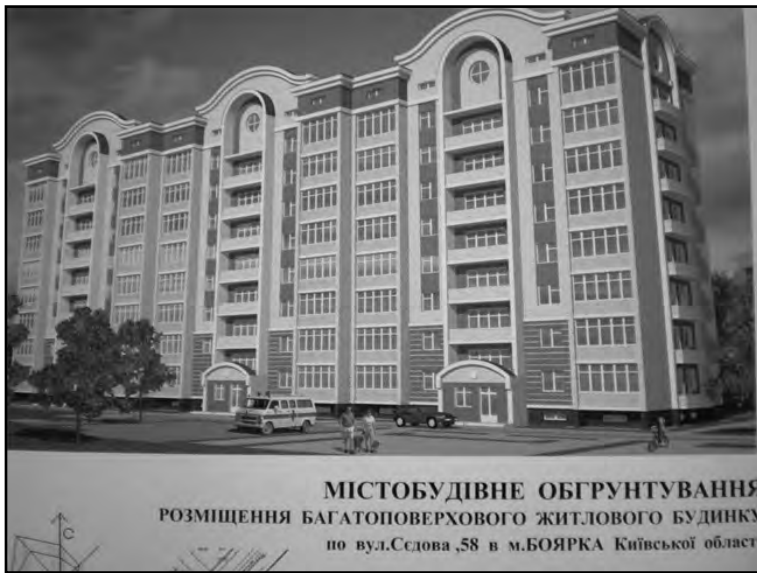
МІСТООБУДІВНЕ ОБГРУНТУВАННЯ РОЗМІЩЕННЯ БАГАТОПОВЕРХОВОГО ЖИТЛОВОГО БУДИНКУ по вул.Седова,58 в м.БОЯРКА Київської області

тим паче молодіжного, до зали завітали близько семи-десяти зацікавлених осіб. Більша половина з них - молодь. Були присутні і депу-