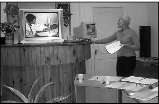
початок на стор. 4