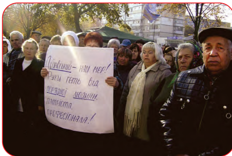
Народне віче “Боярський майдан”