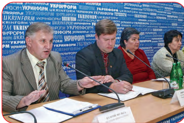
Прес-конференція в “Укрінформ”