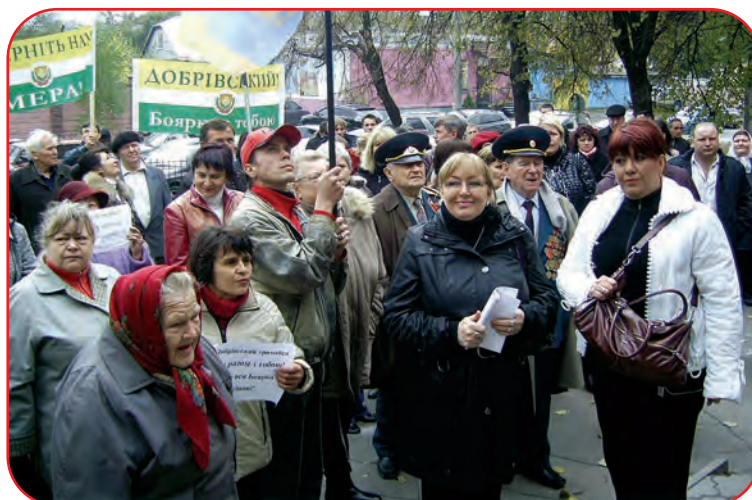
Акція протесту біля К-Святошинського райсуду