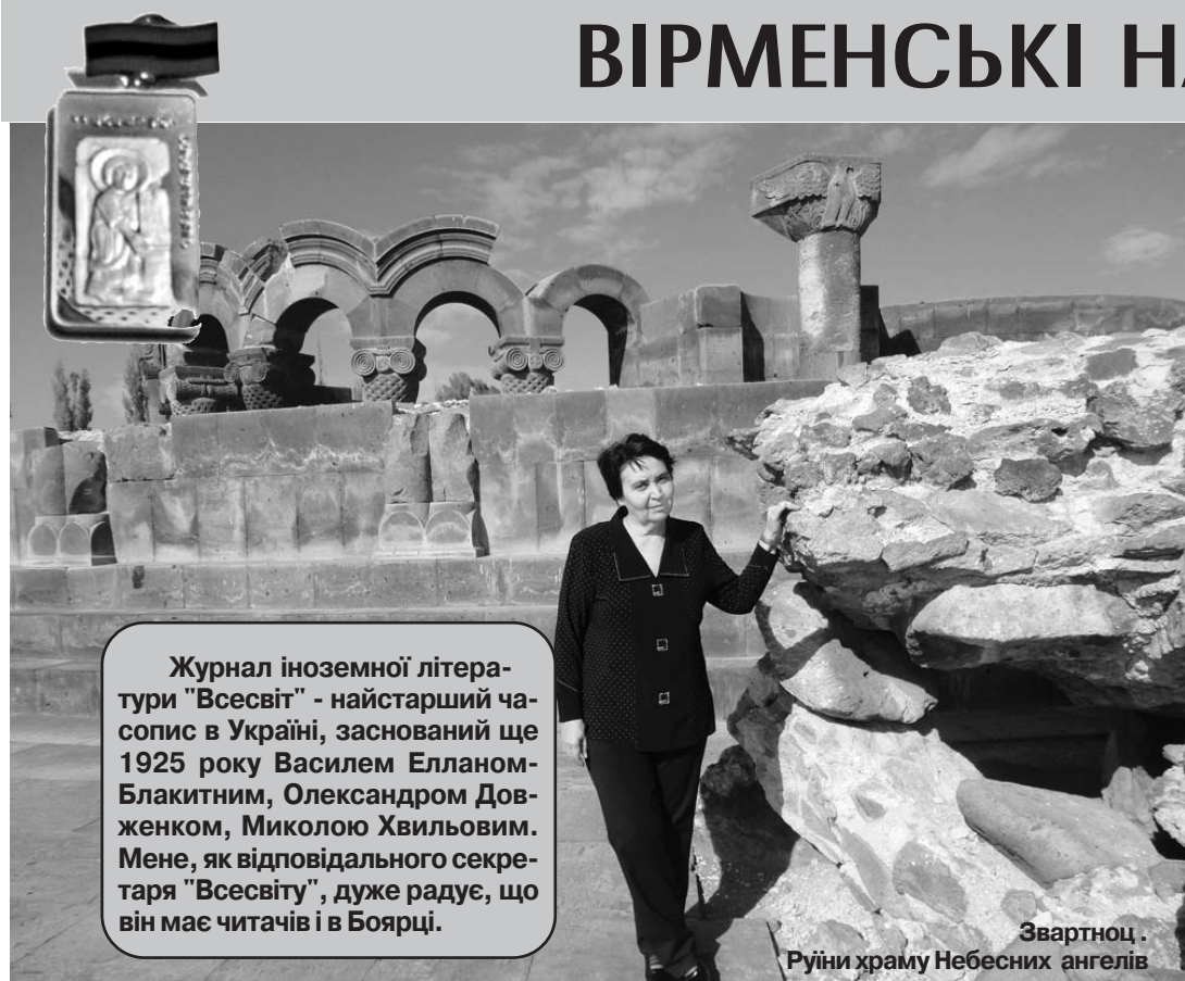
Журнал іноземної літератури "Всесвіт" - найстарший часопис в Україні, заснований ще 1925 року Василем Елланом-Блакитним, Олександром Довженком, Миколою Хвильовим. Мене, як відповідального секретаря "Всесвіту", дуже радує, що він має читачів і в Боярці.