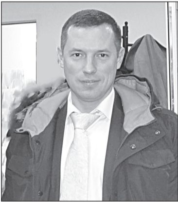
ОЛЕКСАНДР СЛОБОДУК, голова фракції Блок Петра Порошенка «Солідарність»:

Хочу зазначити, що цей рік був непростим. Це був період становлення не лише нашої фракції, а й всього депутатського корпусу. Відбулось формування депутат-