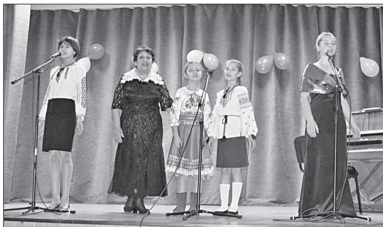
12 листопада в залі Боярської ЗОШ № 5 відбувся звітний концерт ансамблю «Сузір'я» та юних зірочок колективу.