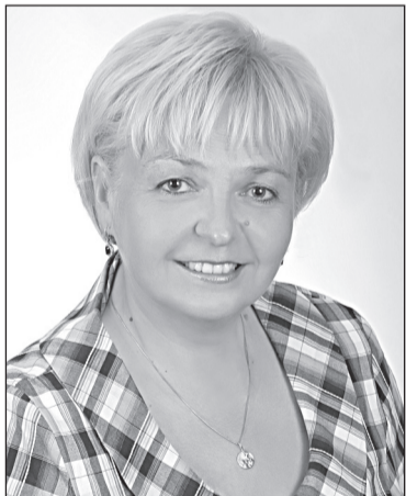
ОКСАНА БОЙКО, голова фракції «Об'єднання «Самопоміч»:

Якщо говорити про політичну діяльність, то наша команда дуже молода. Усі ми прийшли заради позитивних перетворень у рідному місті. Команда «Самопоміч» — це колектив однодумців, який складається з депутатів та активістів.