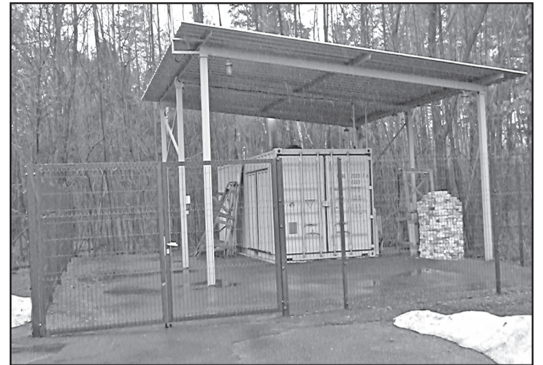
У 2011 р. введено в експлуатацію інсинератор для знешкодження біомедичних відходів та інфікованих матеріалів

У корпусі, збудованому в 1995 році, розмістились легенево-хірургічне, терапевтичне відділення з ліжками для дифе-